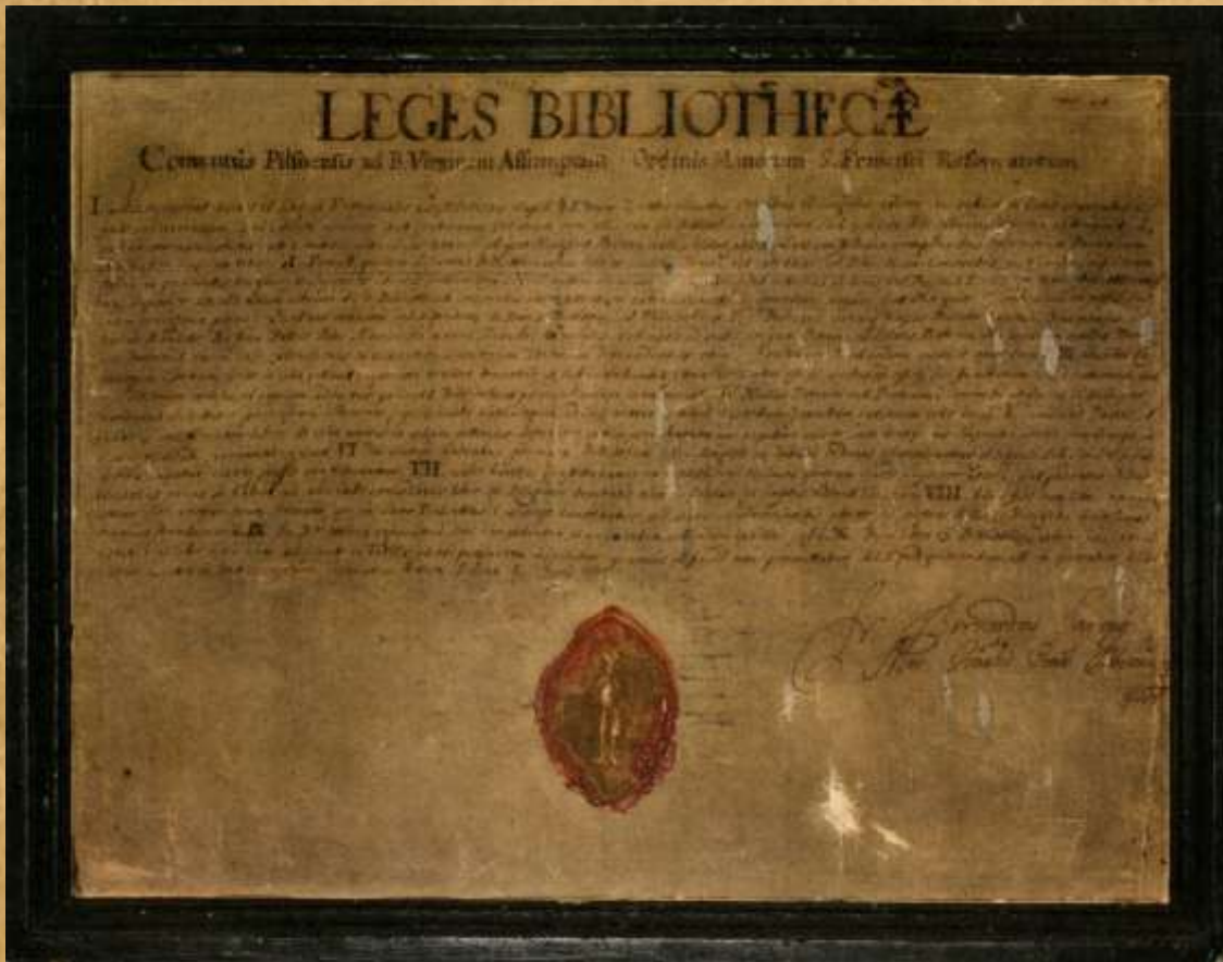
SVK Plzeň, 21 M 673