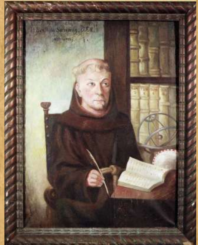
Portrét Sanniga, knihovna u P.M. Sněžné, Praha