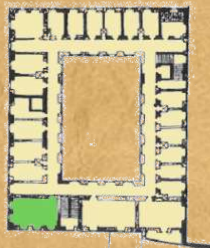
Hostinné, knihovna v letech 1689-1930 a 1938-1950